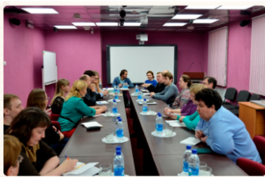
Первый «День муниципалитета» 24 сентября 2015 года