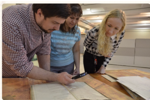
Сотрудники архивных служб Чайковского и Карагайского районов на экскурсии, второй «День муниципалитета» 29 октября 2015 года

« День муниципалитета » – день включенного обучения и обмена опытом для работников муниципальных архивов, проходит регулярно в последний четверг месяца.