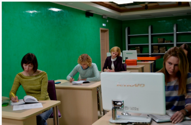
Курсы повышения квалификации в Краевом архиве (19-30 мая 2015)